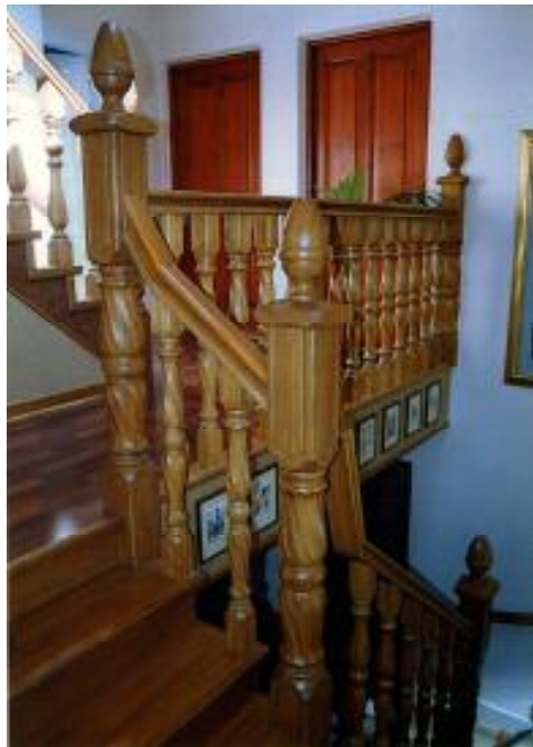
Tallinn Tiigi 6