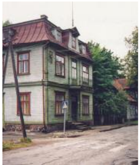
Lasteaed, Kooli 11