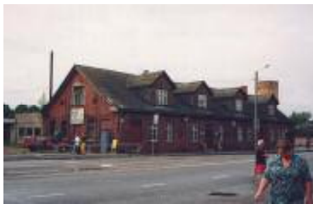
Tööstuskombinaat Tallinna mnt. alguses.