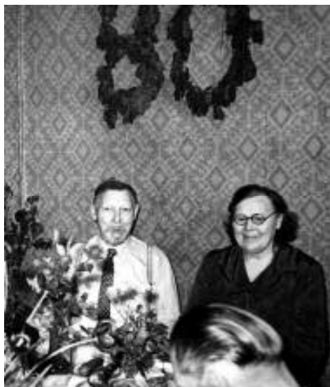
Sepa peremees ja perenaine (Puistamid) oma 80-nda sünnipäeva pidustustel.