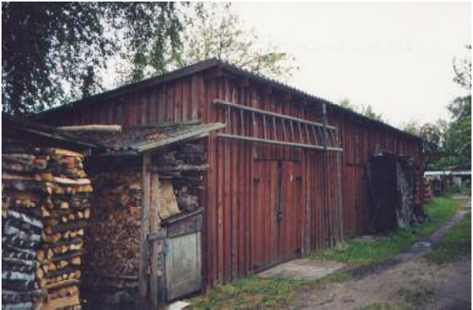
Puukuur Ruudu 7G maja läheduses. Selle kõrvalt puuriitade vahelt pääseb aiamaale.