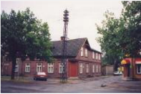
Riia mnt. 93, kus Joalate pere aknad olid Kanali tänava pool teisel korrusel tagumised