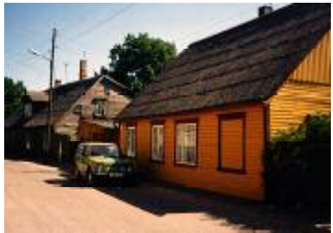
Väike-Sepa 6 Pärnus

E simest korda tutvusid nad viis aastat varem 1. mail 1953 Pärnus Rääma II Kultuurimajas tantsupeol. Kuna 1. mail abielusid ei registreeritud, peeti pulmad 30. aprillil.