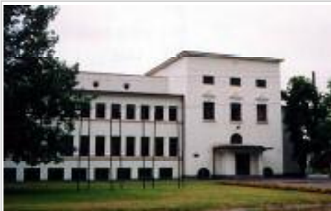
Pärnu I Keskkool, Kooli 13