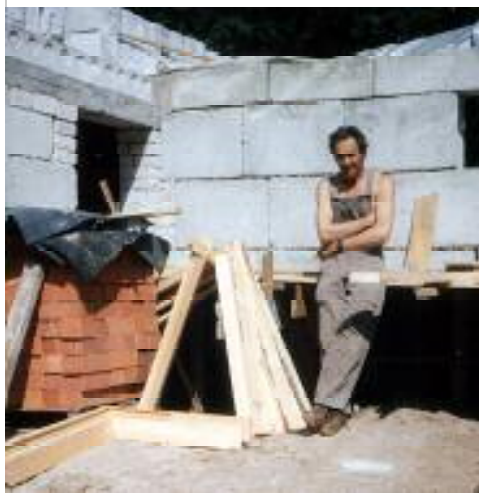
Tallinnas Tiigi tänava ehitustöödel.