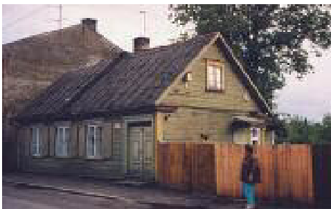
Esimene elukoht Pärnus Suur-Kuke 25