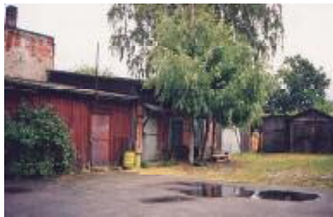
Riia mnt. 50 hoovimaja

K ooliteed alustas Ain lasteaiakõrval asuvas Pärnu I mitmetäielikus 7-klassilises koolis.