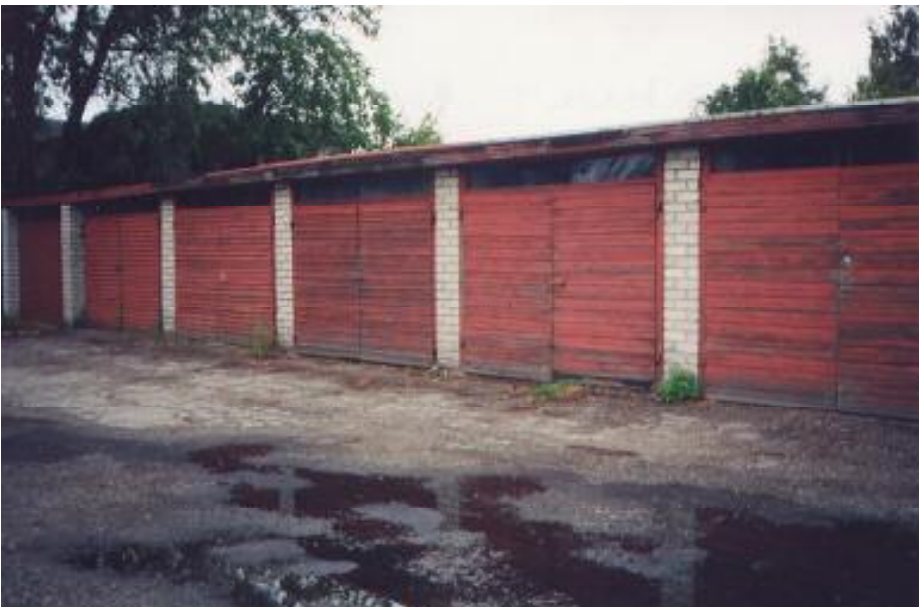
Ruudu 5 maja otsas asub autogaraaz, milles Ain on ehitanud paate, remontinud autot ja teinud palju muud huvitavat ja vajalikku.