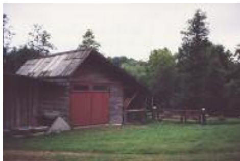
Heinaküün Reius öde Maie hoovil.

VAPAKU ehk vana paadi kuur Reiu jõe kaldal. Majake, kus võis magada, puhata, hoida pisikest paati ja muud varandust. Kevadine jääminek on mitmel korral üritanud VAPAKU-t endaga kaasa viia, aga alati on õnnestunud see ära päästa.