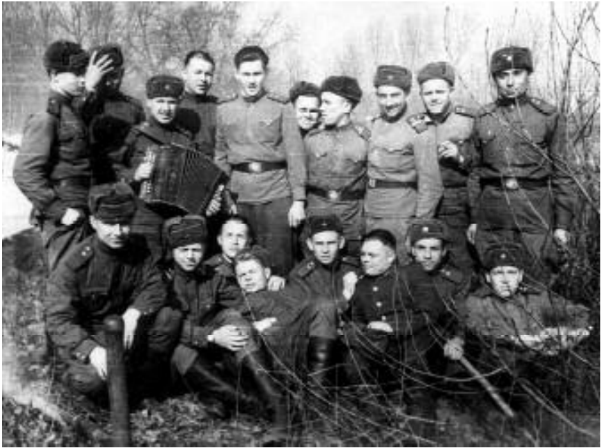
Veel üks pilt sõjaväekaaslastega.