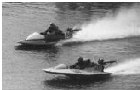
Ajalooline foto Tartust O-175 klassi paatide ühest viimastest võistlustest Eestis, kus Ain Joala (esiplaanil) möödub viimasel ringil Lembit Aaslav-Kaasikust.